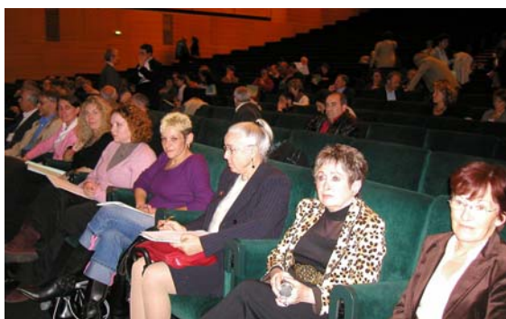
au 1 er rang : les 9 membres du jury citoyen ligérien

Le jury, composé de citoyens désignés de façon aléatoire et sensibilisés lors de 2 réunions d'information préalables, a ensuite réagi et posé des questions débattues avec les experts et la salle. De nombreuses questions ont été abordées, comme la banalisation de l'ivresse chez les jeunes, le caractère de cible privilégiée de cette population pour les alcooliers (premix, sponsoring des soirées étudiantes), la précocité des consommations comme indicateur privilégié d'une consommation excessive, la notion de capital santé à préserver, le rôle de l'entourage dans la prise de conscience d'une sur-consommation d'alcool, l'évolution du regard porté sur les personnes alcooliques, le rôle essentiel des associations.