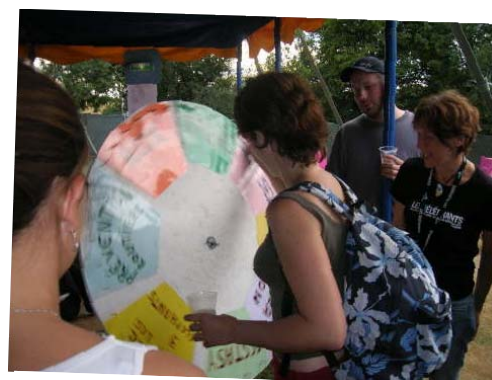
La roue de la fortune