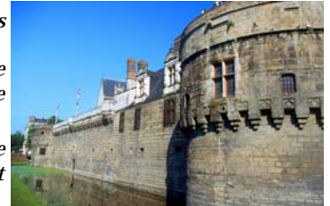
Château des Ducs de Bretagne - Nantes

A travers l'éclairage apporté par des experts et le bilan des états généraux de l'alcool, ce numéro contribuera à élaborer de nouvelles pistes d'actions pour lutter contre ces consommations excessives et qui, pour ce qui concerne la consommation d'alcool, fait encore aujourd'hui l'objet d'une grande tolérance.