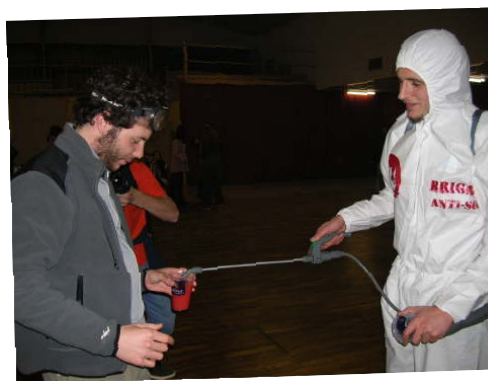
La brigade anti-soif